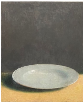
ロバート・ボシシオ Untitled, 2024 mixed media on canvas 151 x 124cm ©Robert Bosisio