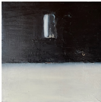
平松 麻 ブルー 2024 oil on canvas 18 x 18cm